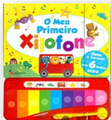
O Meu Primeiro Xilofone Editor: Livraria Civilização Editora

Uma aranha começa a tecer sua teia. Ao longo do processo, alguns animais da quinta aparecem, tentando captar a sua atenção, mas ela está tão concentrada no seu trabalho que os ignora. Finalmente, quando termina e adormece, é possível não só apreciar a sua obra de arte, como também a utilidade da mesma.