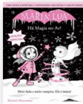
Maria Lua de Harriet Muncaster Editor: Booksmile