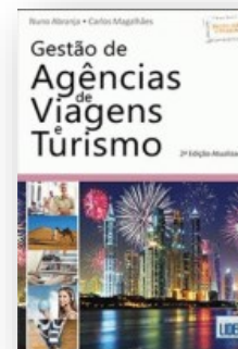
Gestão de agências de viagens e turismo Nuno Abranja, Carlos Magalhães Editora Lidel 2018