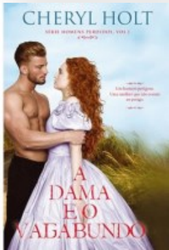
As Dama e o Vagabundo Cheryl Holt Editora Quinta Essência 2018