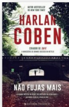
Não fujas mais Harlan Coben Presença 2020

Sinopse: Justa, a sua querida ama, não duvidava de que era o Escolhido, aquele que as profecias anunciavam estar destinado a reconquistar Jerusalém, e a unir os homens sob a mesma Fé. Não nasceu para ser rei, mas a roda da fortuna tornou-o duque de Beja e herdeiro de D. João II. Viu morrer o sobrinho e assassinar irmão e cunhado para subir ao trono a 27 de outubro de 1495. As naus do Venturoso chegaram à Índia e ao Brasil construindo um Império, digno do rei mago do Ocidente, como, em segredo, se intitulava.